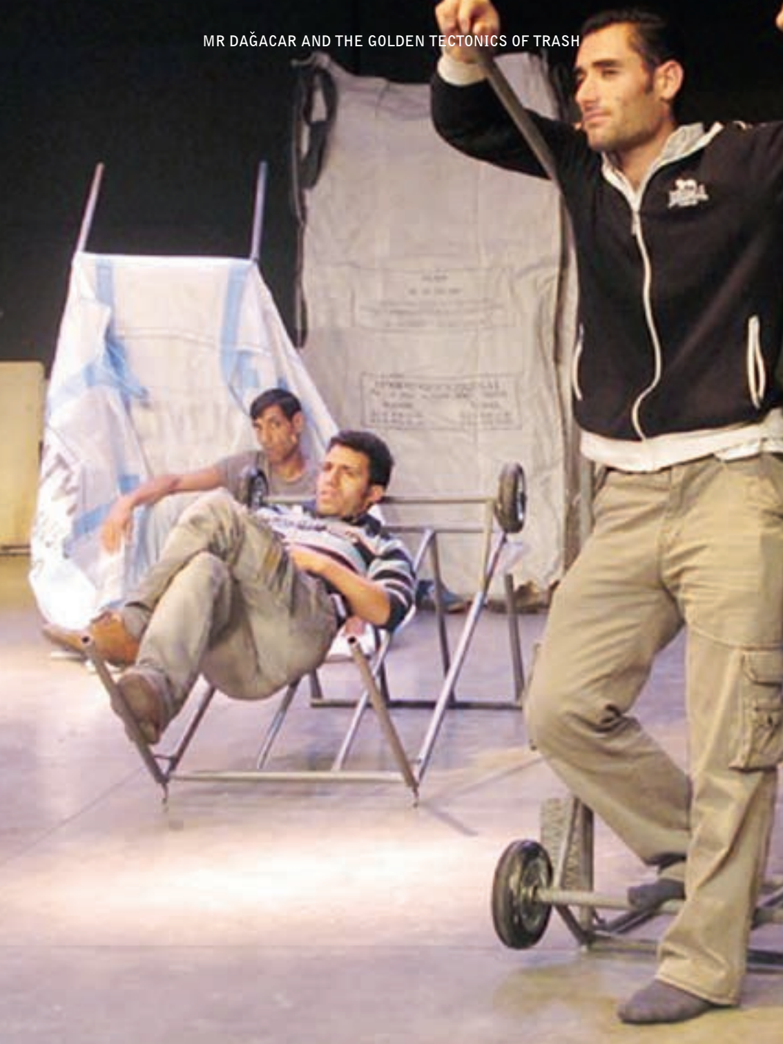
PIERRE OU LES AMBIGUÏTÉS